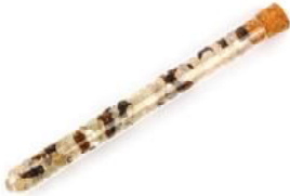
Wellness Mix Goldenes Dreieck gemischt (Amethyst, Rosenquarz, Bergkristall)