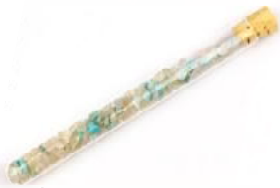
Atlantis Larimar, Bergkristall