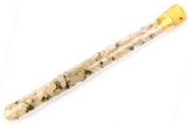
Summertime Bergkristall, Peridot