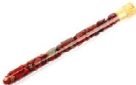
Earth Jaspis rot