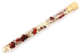
Fitness Bergkristall, Magnesit, Jaspis rot