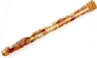
Inner time Karneol, Bergkristall