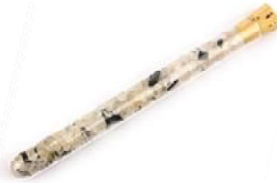
Starseed Bergkristall, Edelschungit