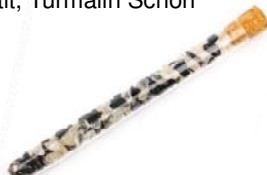
Detox Time Bergkristall, Schungit, Hämatit, Turmalin Schörl