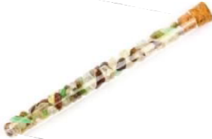
Zufriedenheit Bergkristall, Chrysopras