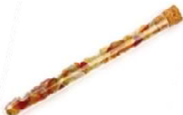
Inner Growth Karneol