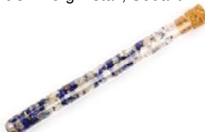
Intuition Bergkristall, Sodalith