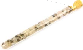
Truth Bergkristall, Labradorit