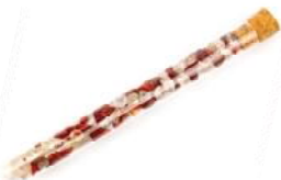
Earth time Bergkristall, Jaspis rot