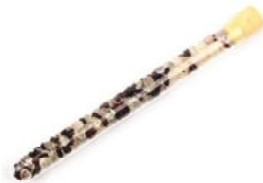
Fireheart Bergkristall, Granat