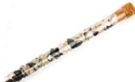
Pull out Hämatit, Bergkristall