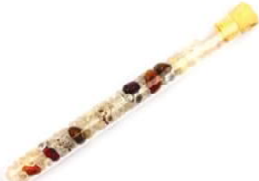
Evulation Mookait, Bergkristall