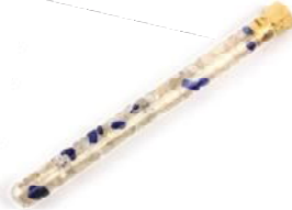
King Lapislazuli, Bergkristall