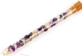
Wellness Goldenes Dreieck (Amethyst, Rosenquarz, Bergkristall)