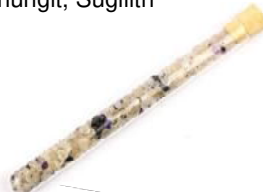
Golden Soutouch Bergkristall, Edelschungit, Sugilith